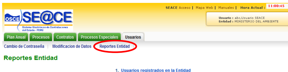
Figura 7 Reportes entidad

Este submenú permite al Funcionario-Usuario de Entidad conocer los usuarios registrados en la entidad, para ello deberá seleccionar la opción “1. Usuarios registrados en la entidad”, tal como se muestra en la siguiente figura: