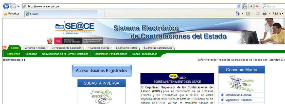
Figura 1 Portal Web del SEACE

El ingreso al sistema para el registro de información relacionada con su Plan Anual de Contrataciones, los procesos de selección, los contratos y su ejecución e información del usuario se hará a través del portal Web del SEACE cuya dirección electrónica es: www.seace.gob.pe .