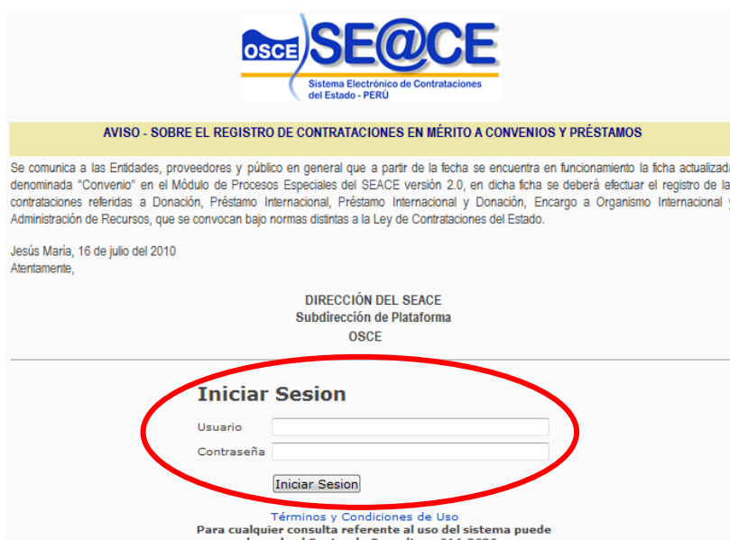
Figura 2 Página de Ingreso al SEACE

En esta página deberá seleccionar el botón “Acceso usuarios registrados”, luego del cual utilizará el Certificado SEACE (Usuario y Contraseña) para autenticación en el sistema e iniciar la sesión.